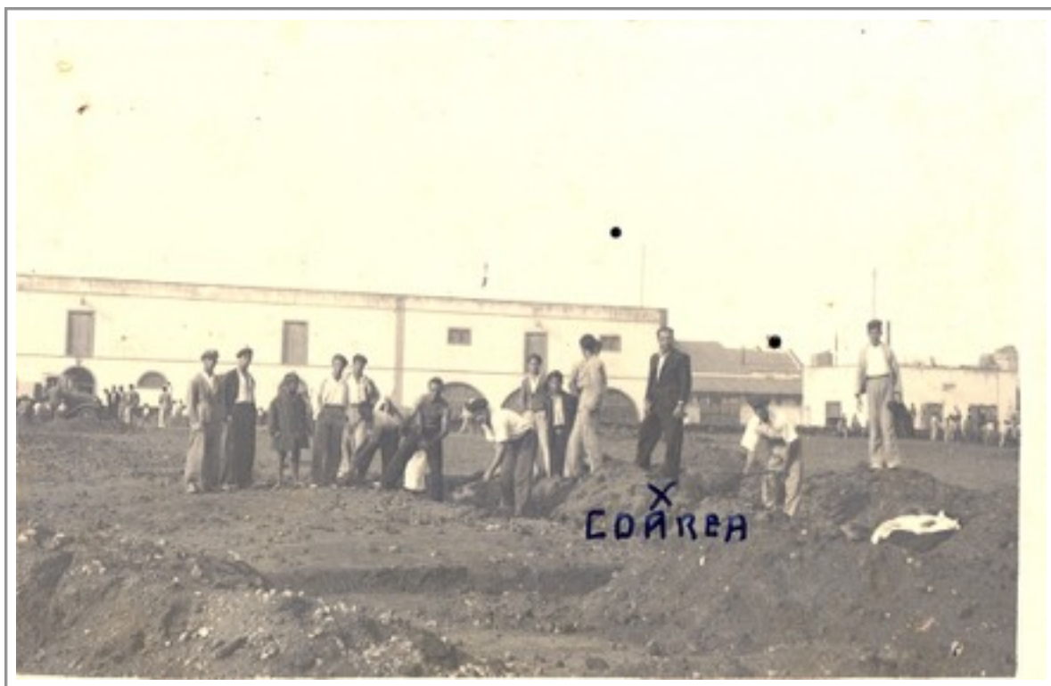
Vecinos del Refugio construyen el "Teso del Porteño"