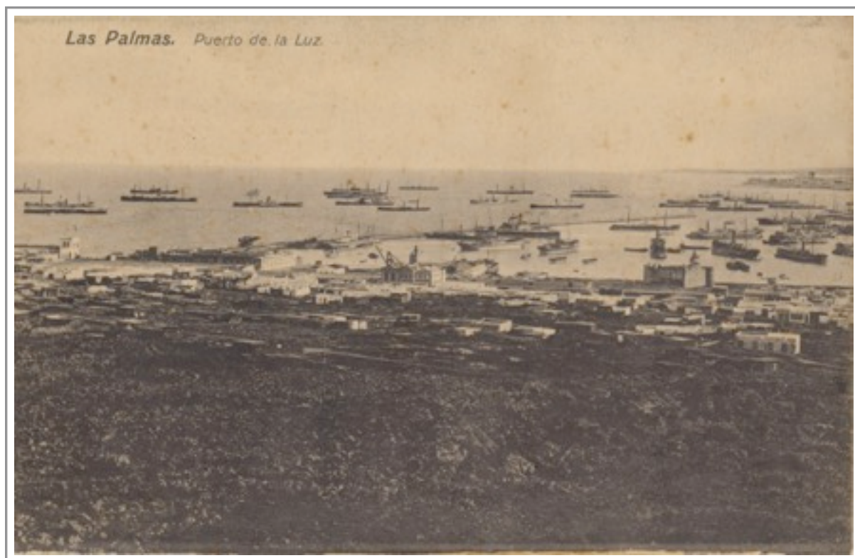
El Puerto de La Luz .Principios S.XX.

En aquellos primeros años del S.XX, el “ juego de la pelota ”, como era conocido por la población insular, era el mas practicado por la muchachada en los arenales y descampados que una ciudad como Las Palmas disponía en sus proximidades.