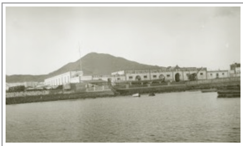
Explanada del Muelle de La Luz.Las Palmas.

Recuerdo y reflexiones de un canario. A. Arbelo Curbelo.