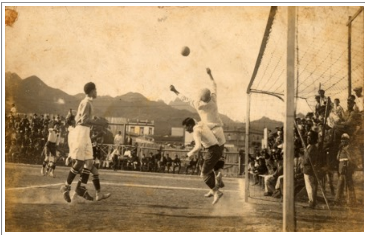
Partido en el campo de la calle Miraflores. Santa Cruz de Tenerife 1914.