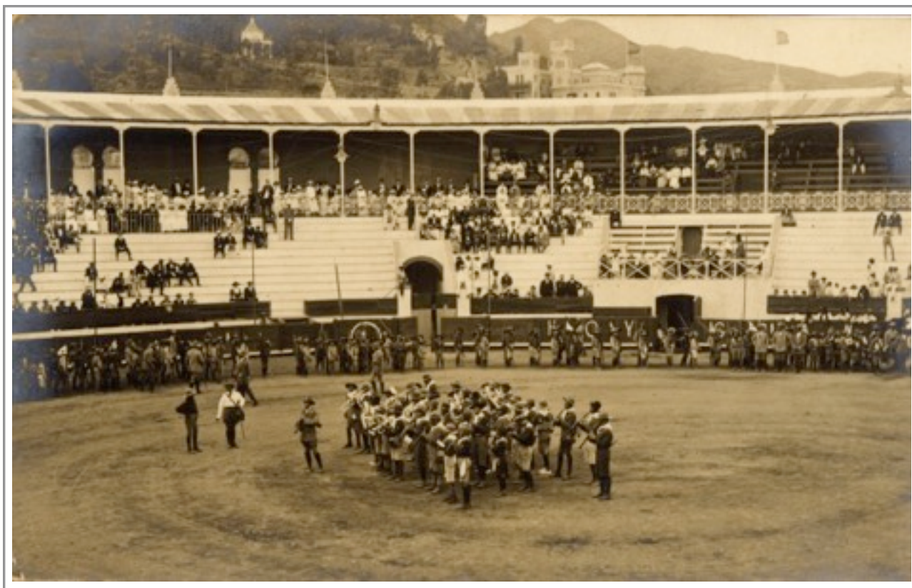
Plaza de Toros de Santa Cruz de Tenerife. 1912.

Es a principios de 1912, cuando los partidos entre los equipos locales empezarían a despertar interés, formándose cordones de espectadores alrededor del campo. Al principio estos espectadores presenciaban los partidos sin sentir emoción alguna, guardando un silencio completo, pero lentamente se fue interrumpiendo este silencio por claros aplausos, con los cuales premiaban a los jugadores que más corrían, y por lo tanto, llegaban antes a la pelota; al que tenía mejor toque de balón, al mejor driblador, y a los que mejor sabían dar las cargas, dando lugar a grandes risas, cuando el otro jugador, más rápido y astuto, se desviaba de la carga y hacía caer al atacante sobre el campo 6