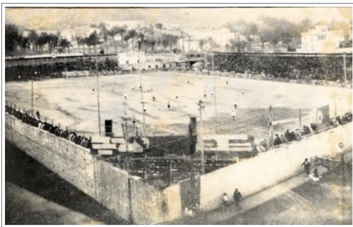
"Campo de Deportes España". Las Palmas.1915.